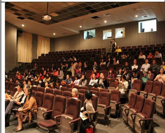
觀眾席 & 控制室